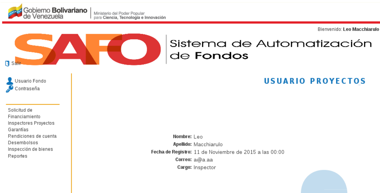
Figura 3. Opción “ Usuario Fondo ”.

3. Contraseña: Al hacer clic sobre ésta opción, el sistema despliega un formulario que le permite al usuario cambiar su contraseña y su pregunta de seguridad.