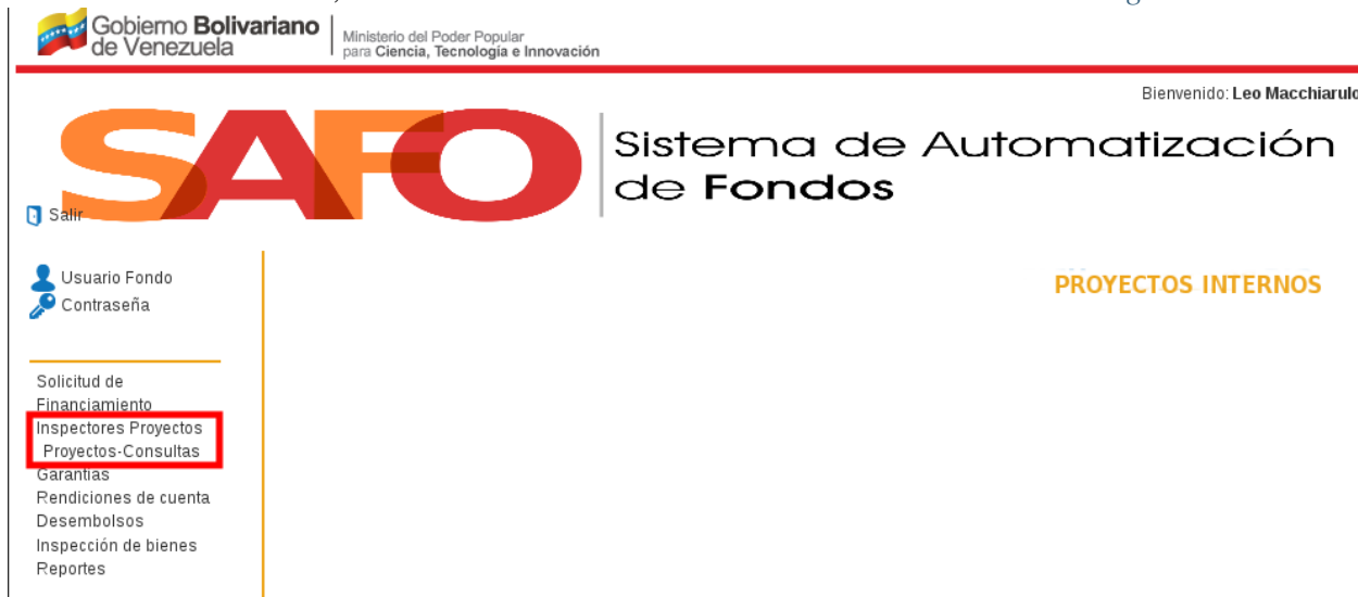
Figura 13. Opción “ Proyectos - Consulta ”.

2. El sistema inmediatamente despliega la opción “ Proyectos - Consulta ”, tal como se muestra en la Figura 13 .