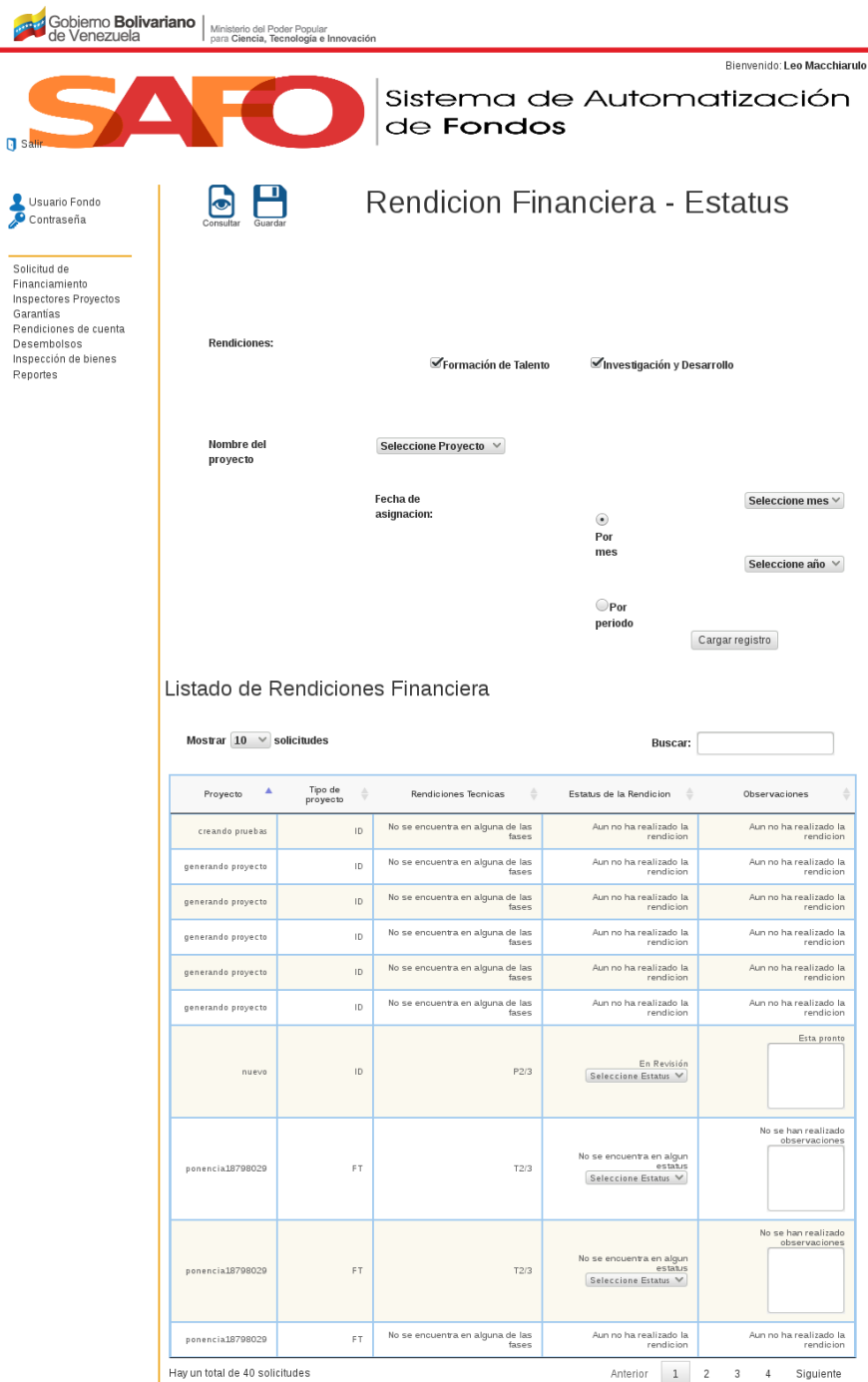
Figura 30. Interfaz “Cambiar Rendición Financiera”.