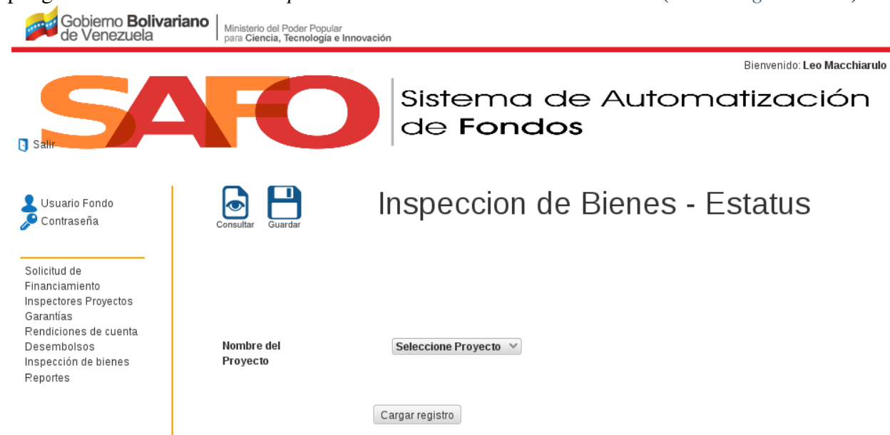
Figura 31. Interfaz “ Inspección de Bienes-Estatus ”.

1. Al hacer click sobre la opción “ Inspección de Bienes ”, el sistema despliega la interfaz “ Inspección de Bienes- Estatus ” (Ver Figura 31 ).