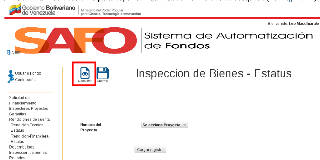
Figura 28. Interfaz “Rendición Financiera Estatus”.

9. Luego el sistema presenta la interfaz “Rendición Financiera-Estatus”. Seguidamente haga clic en “Consultar” ubicado en la parte superior izquierda del formulario de búsqueda (Ver Figura 28 ).