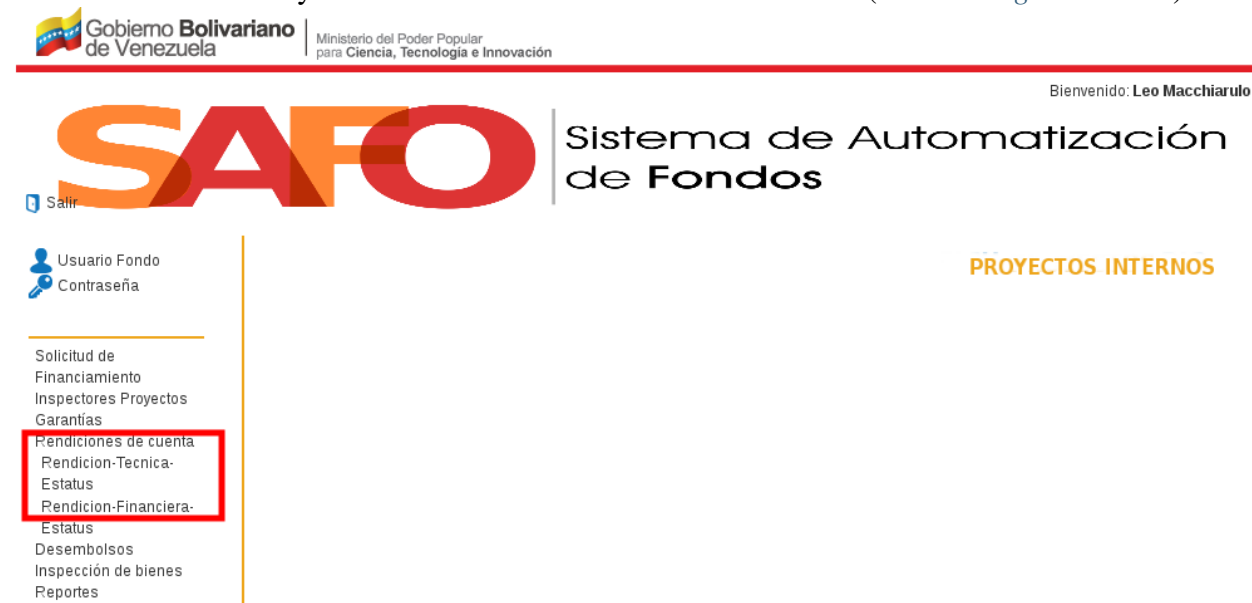
Figura 23. “ Menú Rendiciones ”.

1. Una vez que el usuario haga click sobre el botón “ Rendiciones de Cuenta ”, el sistema despliega un sub-menú con las opciones “ Rendición-Técnica-Estatus ” y “ Rendición-Financiera-Estatus ” (Ver Figura 23 ).